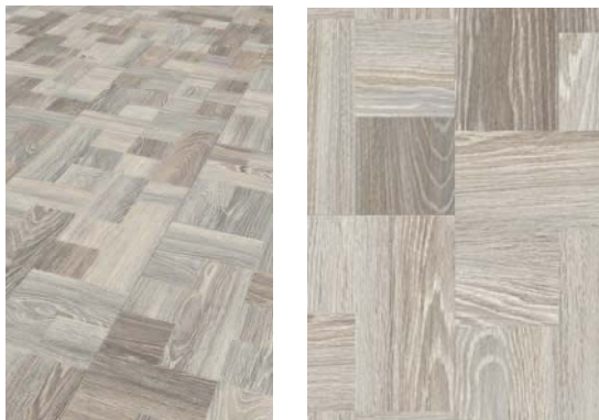
Bilddateien pblm785, Produkt: „Trendtime 4 Eiche Louvre gekälkt“

Auch die Schachbrettoptik des Dekors „Eiche Louvre“ ist ein Klassiker, den man aus historischen Gebäuden kennt. Alle Dekore sind in modernen Farbstellungen erhältlich, im Bild die Farbvariante „gekälkt“.