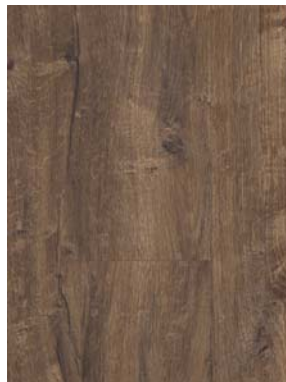
Bilddatei pblm810, Produkt Laminat „Trendtime 1 Eiche Tradition antik“