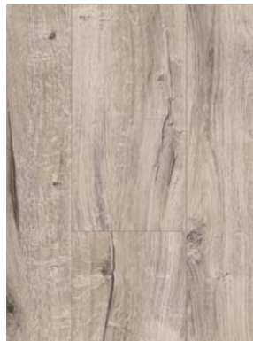
Bilddatei pblm793, Produkt: Laminat „Trendtime 1 Eiche Century geseift“