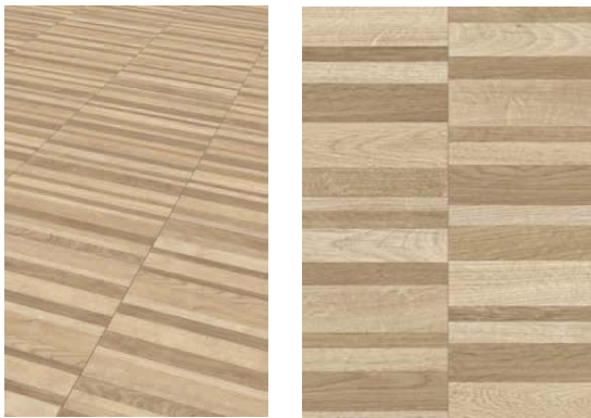
Bilddateien pblm798, Produkt: „Trendtime 4 Eiche Maritim natur“

Mit dem Laminatdekor „Eiche Maritim“ haben die Parador-Designer ein Bootsdeck kopiert. Dieser Boden passt jedoch nicht nur zu Seglern und Menschen mit Fernweh. Mit seinem ruhigen, symmetrischen Bild in heller Farbgebung fügt er sich in viele Wohnstile ein.