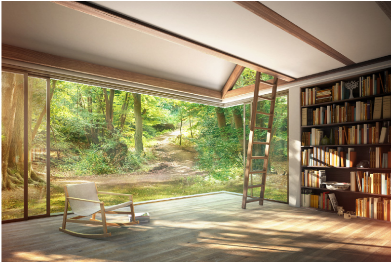
Bild (pbho283.jpg): Im Einklang mit der Natur: Das Parkett „Eiche Basalt“ aus der neuen Produktserie „Eco Balance“ von Parador.