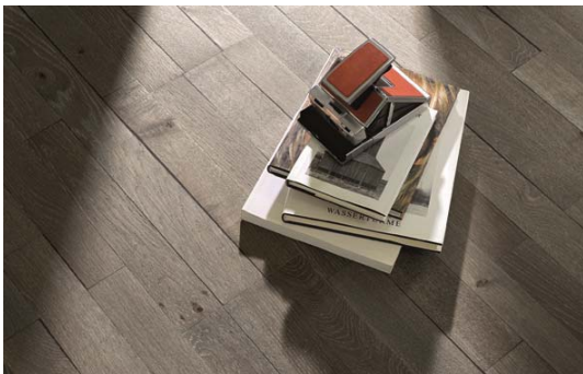
Bilder pbho319 und pbho317: Parkett Trendtime 9 Eiche Old Block Basalt