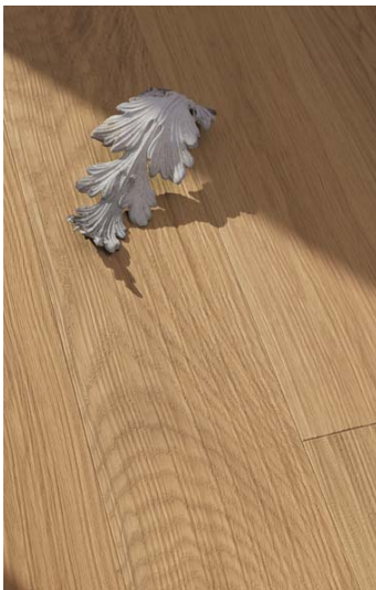
Bilder pbho323 und pbho321: Parkett Trendtime 6 Eiche sand wavescraped