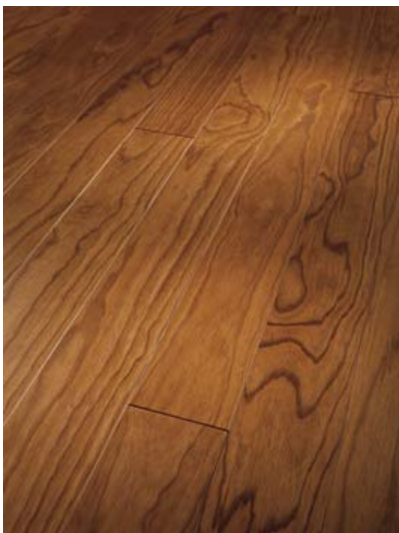
Bilder pbpm542 und pbpm543: Parkett Trendtime 1 Lignia Brasilica und Trendtime 1 Lignia Tuscany